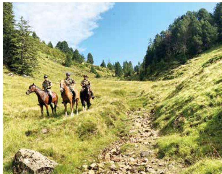
Die Route am Samstag musste in Zweier-Patrouillen mit Karte und Koordinaten selbst gefunden werden