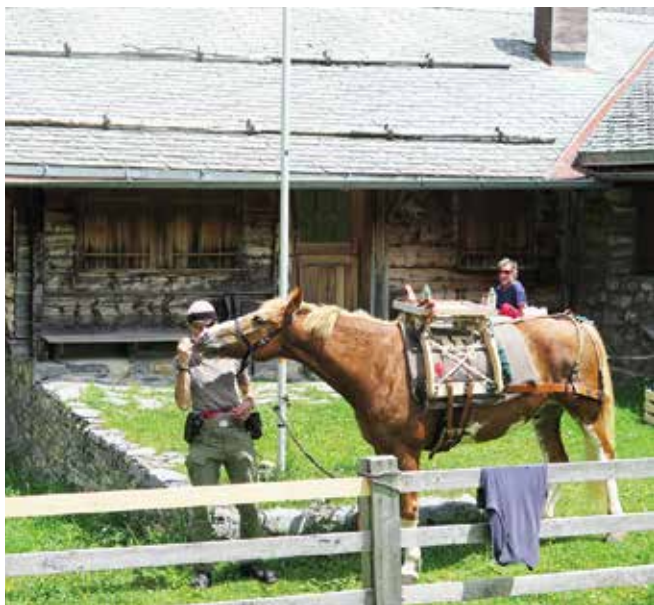
Mittagsrast bei der Winteregg-Hütte SAC Niesen