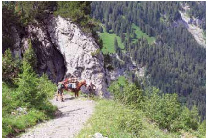
Gemmiweg, Abstieg bei Nasse Bode, Blick zum Ueschinetäli