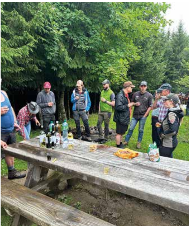
Apéro au pied de la tour du Gibloux