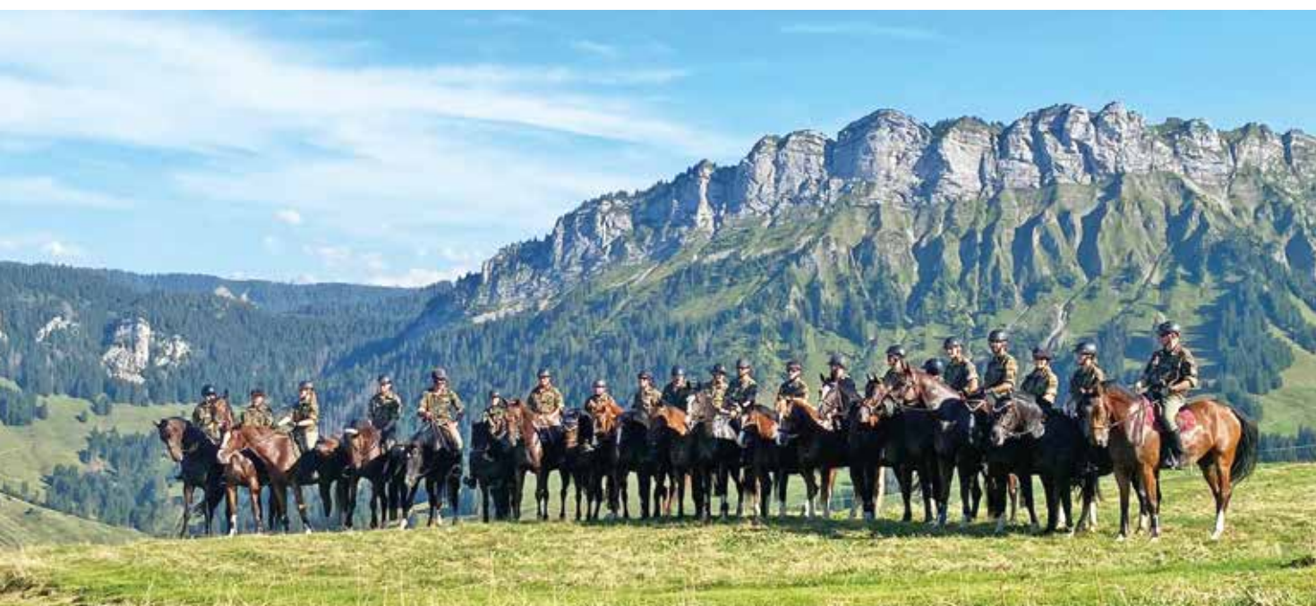
Patrouillen-Ritt der BTG im Entlebuch

Trotz grosser Leistung und technischer Herausforderungen für Reiter und Pferde bei sommerlicher Wärme schafften die meisten Patrouillen den Weg reibungslos zurück. Nach der Verpflegung der Pferde