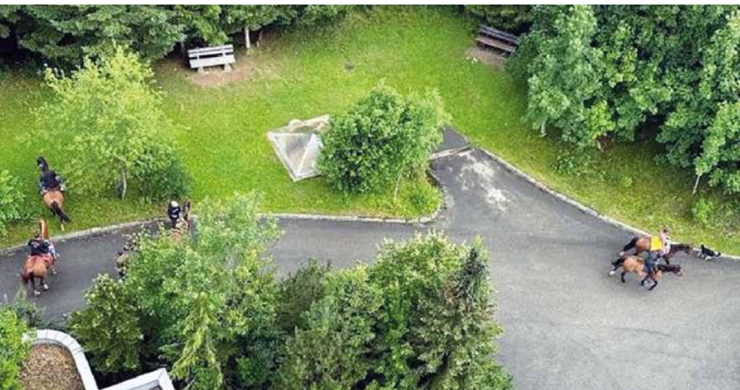
Les cavaliers font tout petits vus d'en haut !