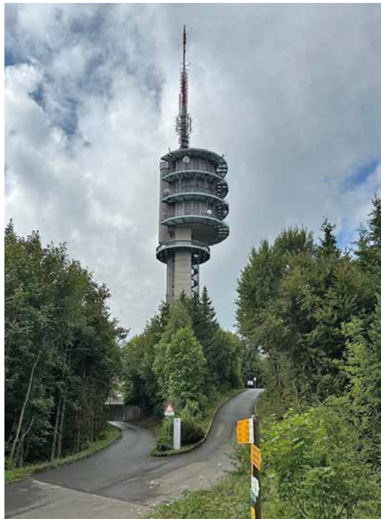
La tour vu d'en bas