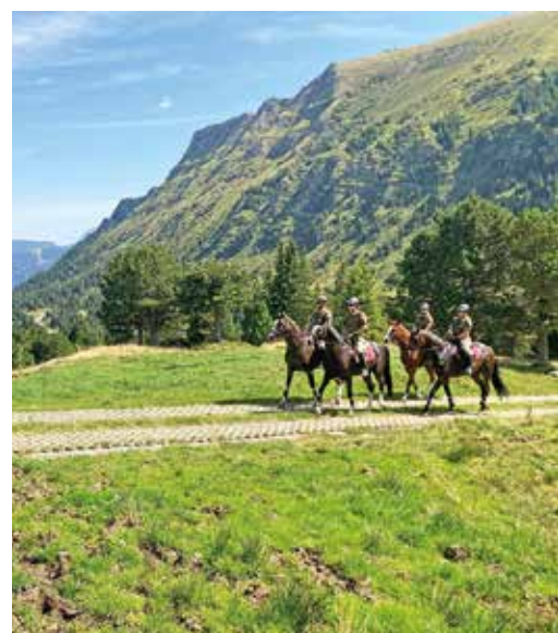
Ritt Richtung Alp Wasserfallen