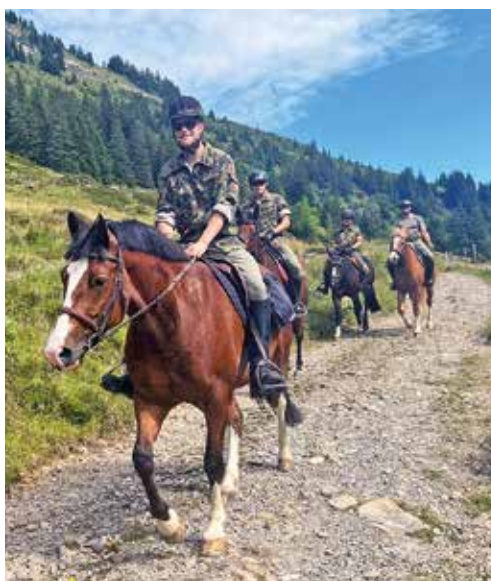
Ritt Richtung Alp Chlusermättli