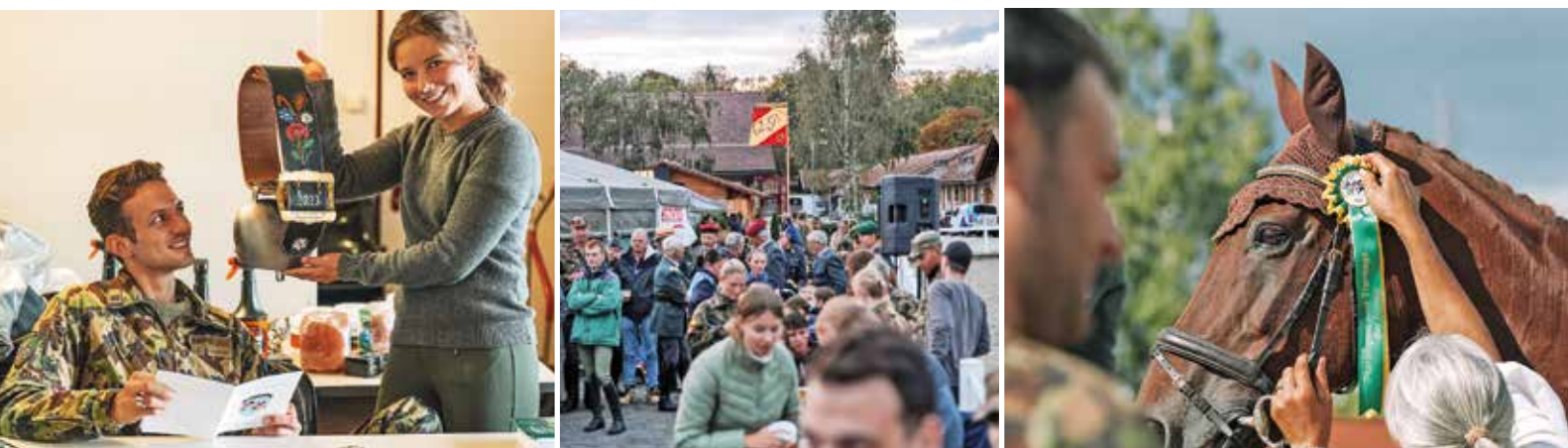
Lauter fröhliche und zufriedene Gesichter...