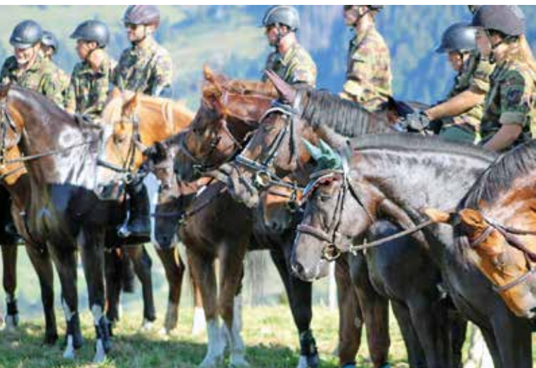
21 Reiter: Von der Ost- bis Westschweiz. Von Soldat bis Oberst. Von Jahrgang 1954 bis 2000

Patrouillen-Ritt der Bernischen Train-Gesellschaft (BTG) vom 18. – 20. September 2023