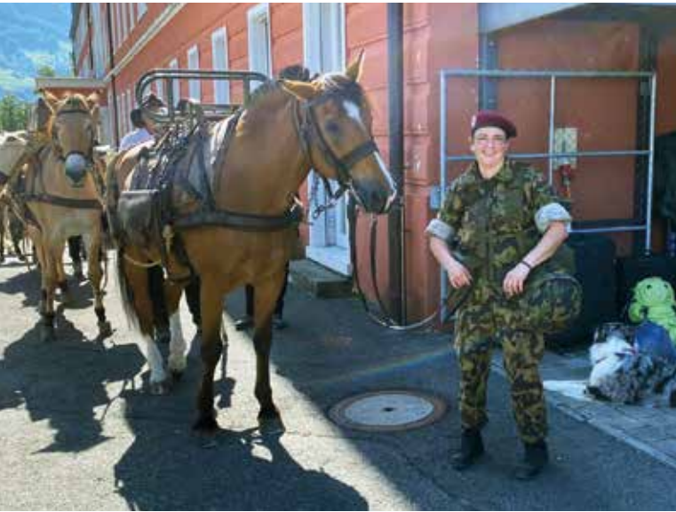
Pünktlich zum Eröffnungs-Zug waren mein Kamerad "Lady Killer" und ich bereit.