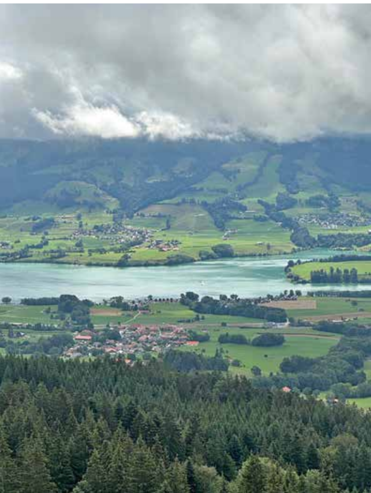
Vues sur la région depuis le haut de la tour