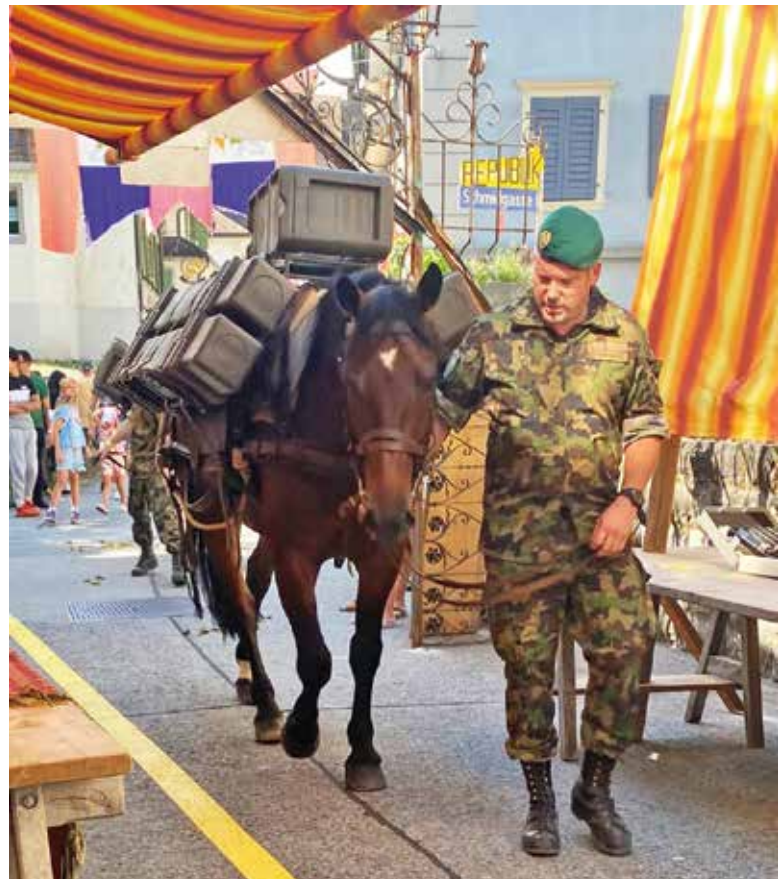
Mitten durch eine Menschenmenge und zwischen Marktständen hindurch: