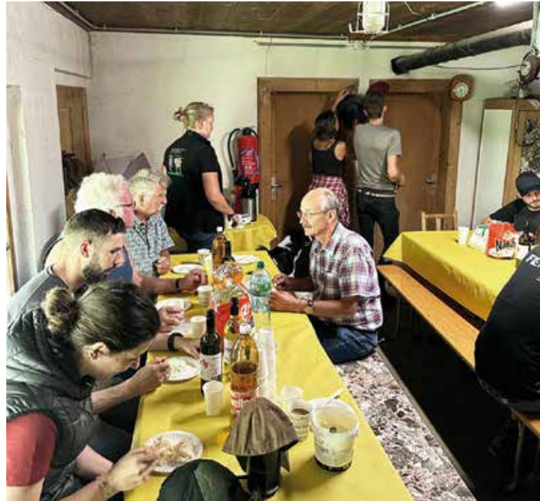
Repas en commun, amitié et convivialité