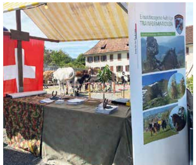
Mit guter Laune und verschiedenen Informationsunterlagen und Plakaten des Komp Zen Vet D u A Tiere warben wir für das Pferd in der Armee.

Acht Tage nach dem Säumerfest drehte das Wetter und es wurde kalt und nass. Einige Pässe, darunter auch der Gotthardpass, wurden phasenweise sogar gesperrt. Dies sind nicht die besten