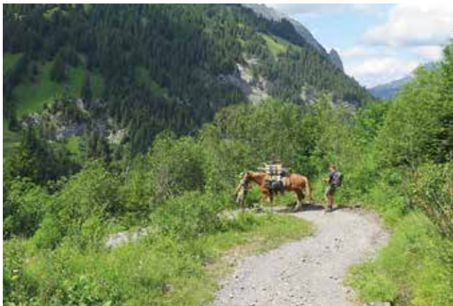
Gemmiweg, Abstieg bei Nasse Bode, Blick nach Kandersteg