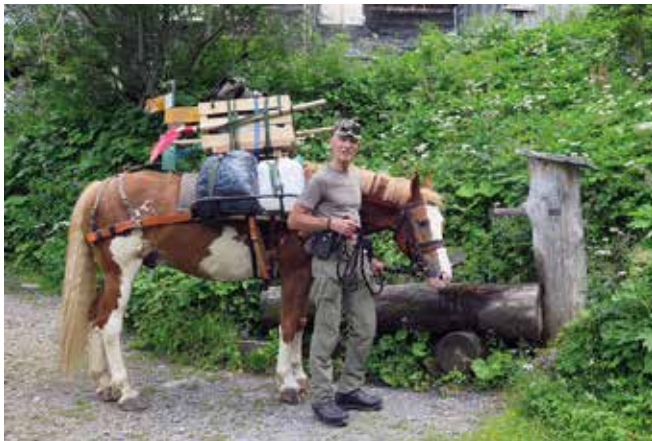
Gemmiweg, Abstieg bei Uf em Stock