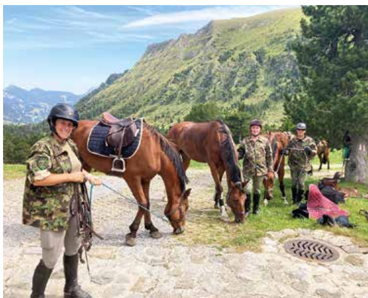
Ankunft Alp Wasserfallen