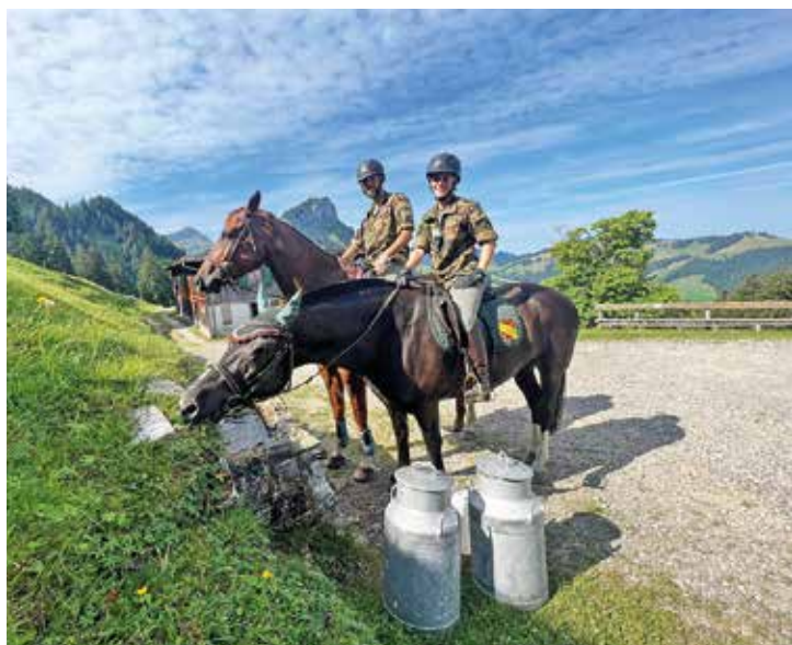
Trinkpause beim Schimbrigbad