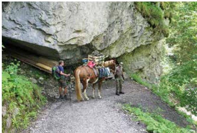
Gemmiweg, Abstieg zwischen Nasse Bode und Chluse