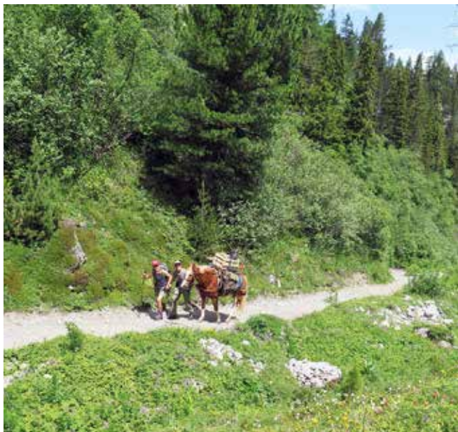
Gemmiweg, Aufstieg von Kandersteg zur Winteregg