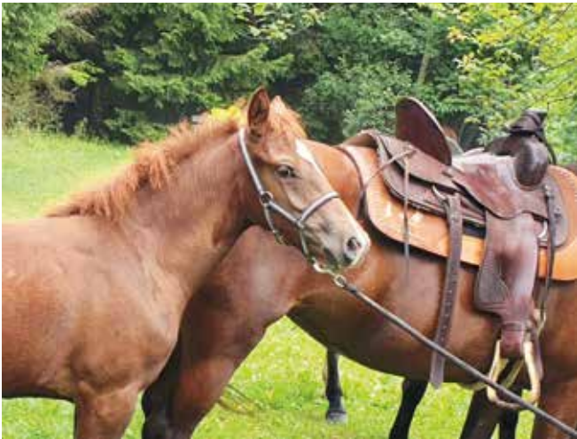
Une pause bien méritée également pour les chevaux