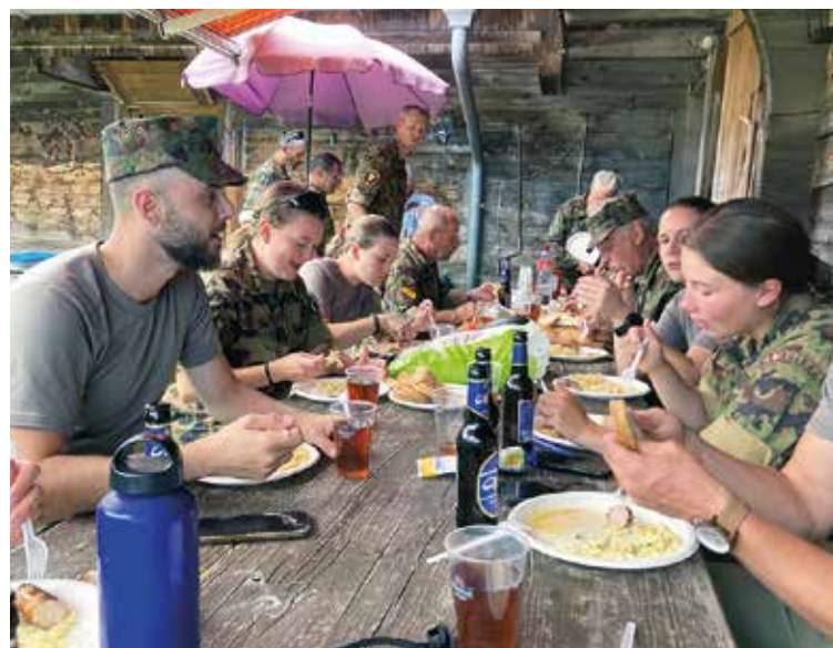
Mittagspause Alp Wasserfallen